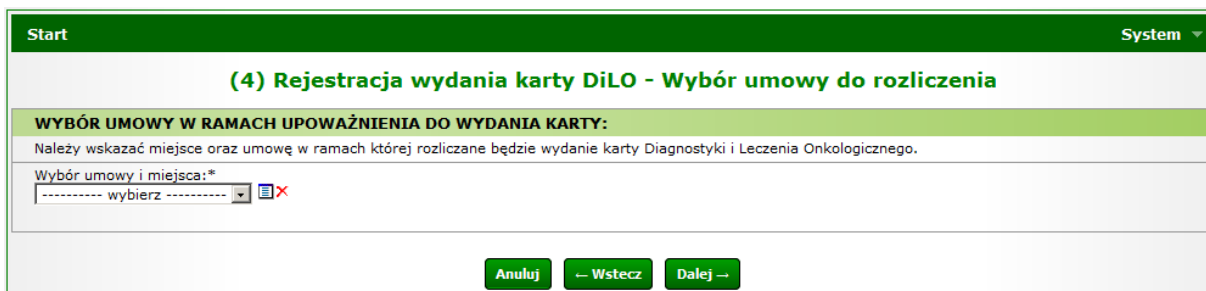
Rysunek 8 Przykładowe okno (4) Rejestracji wydania karty DiLO w AOS

Ostatni krok uzupełniania danych wymaga wybrania umowy i miejsca udzielania świadczeń, w ramach której nastąpi rozliczenie świadczeń związanych z wydaniem karty DiLO.