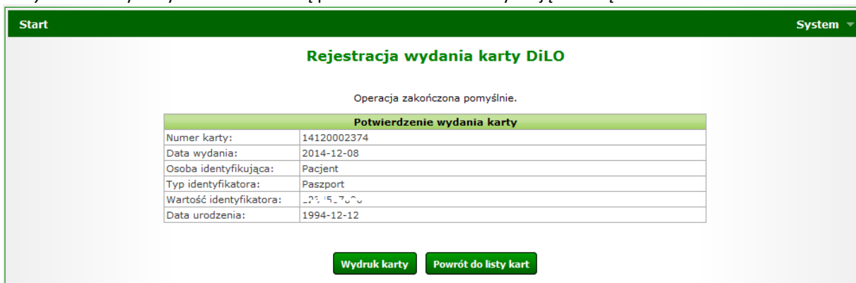
Rysunek 9 Przykładowe okno potwierdzenia wydania karty DiLO w AOS

Operacja zatwierdzania rejestracji wydania karty DiLO spowoduje wyświetlenie okna Potwierdzenia wydania karty . W oknie tym wyświetlone zostaną podstawowe dane identyfikujące kartę DiLO.